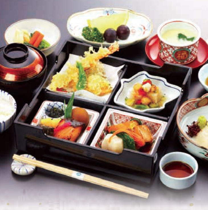
※写真はイメージとなります。