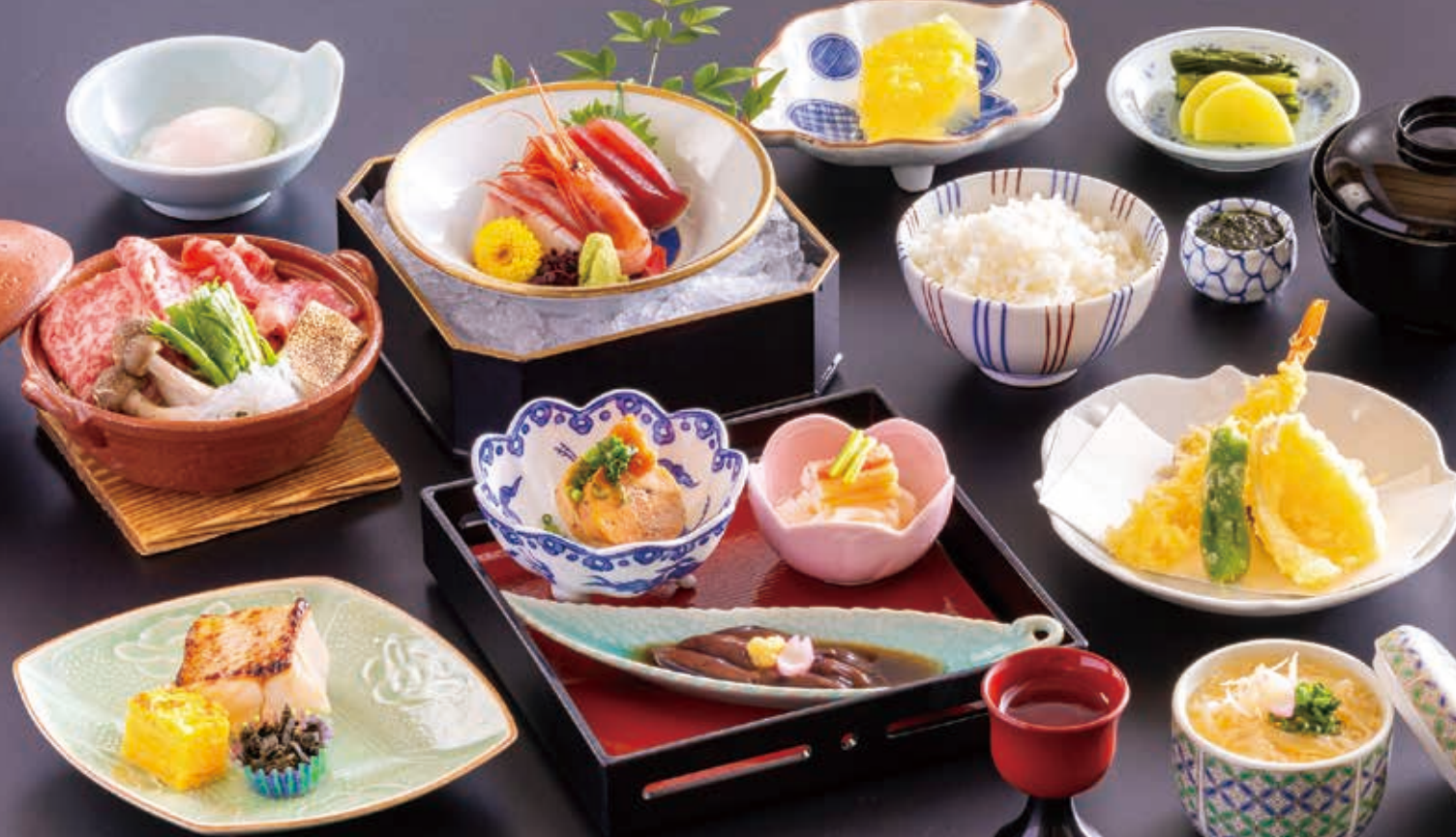
※写真はイメージとなります。